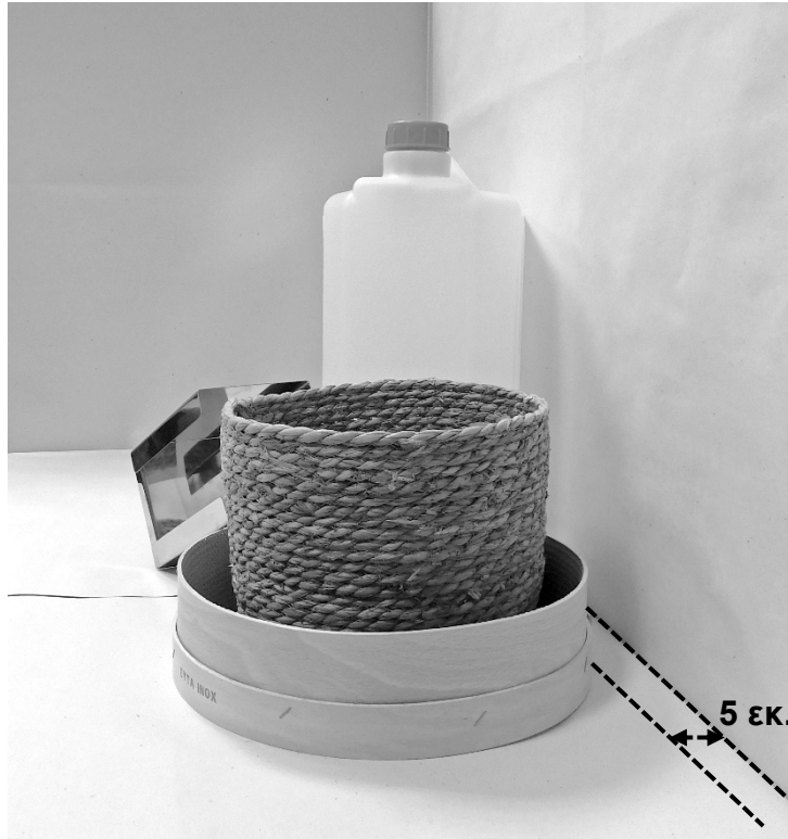
τρίτη φωτογραφία: πλάγια όψη 1