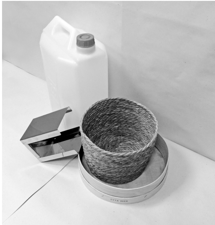
έκτη φωτογραφία: άποψη υπό γωνία